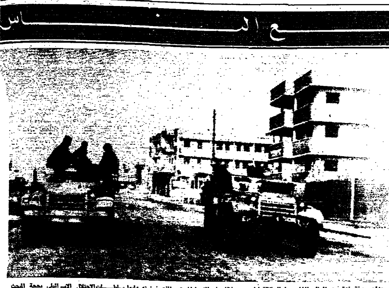
عزلت مدينة غزة عن العالم الخارجي طوال ثلاثة ايام بسبب نظام منع التجول المستمر الذي فرضته عليها سلطات الاحتلال الاسرائيلي بجبهة الجيش القتالين العرب . وفي الصورة (اليوميات) احدى دوريات الجيش الاسرائيلي تجوب الشوارع الخالية من السكان .

هذا تمهيدا لعقد مؤتمر مصالحة بيني واحبات الموضوع على الرئيس جمال عبد القاصر والملك فيصل عامل الملكة العربية السعودية . وكانت الوزارة قد اصدرت